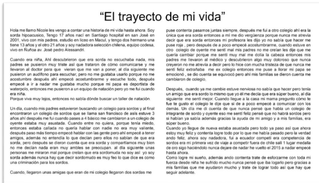
Figura 3 Fotografía ejemplo de producciones finales de las autobiografías desarrolladas

Finalmente, las producciones finales, esto es, los textos autobiográficos que cada estudiante produjo, reflejaron diferencias muy importantes en lo cualitativo y cuantitativo (extensión) respecto de textos elaborados en contexto escolar habitual. A continuación, se ilustra el resultado de la secuencia didáctica con un ejemplo: